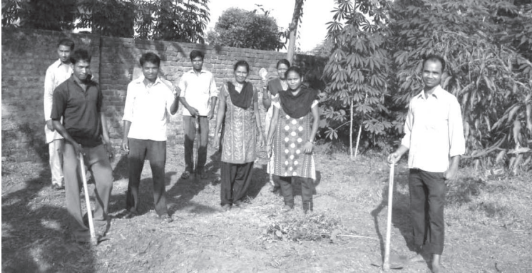
Chavara SHG at work