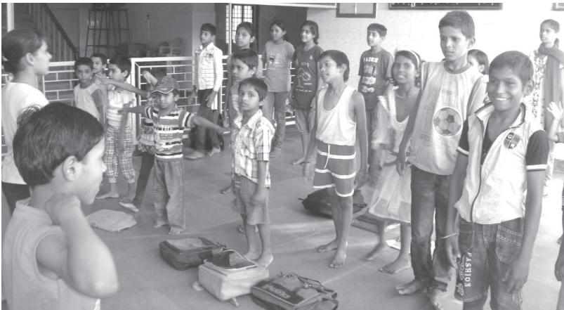
Chavara Study Centre Students at St.Thomas School at Khatauli.